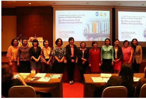
คณะกรรมการชมรมบรรณารักษ์ สถาบันอุดมศึกษา (ช.บ.อ.)