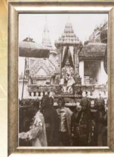
เสด็จฯ โดยกระบวนยานใหญ่ (รัชกาลที่ 7)