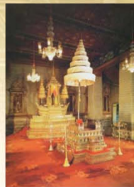
ห้องพระโองการพระที่นั่งอมรินทรวินิจฉัย