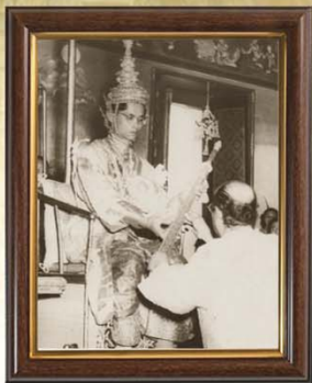
พระที่นั่งภัทรบิฐ