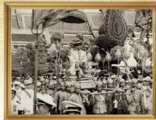
เสด็จฯ โดยกระบวนยานใหญ่ (รัชกาลที่ ๑)